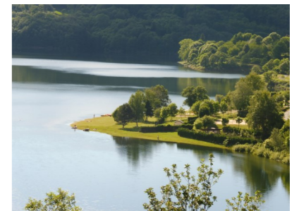
Une vue du lac du Laouzas