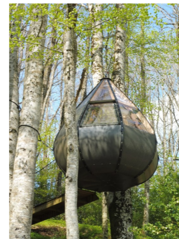
L'hébergement insolite de Payrac : la goutte d'ô