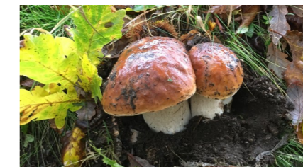
Rencontre au cours d'une balade en forêt