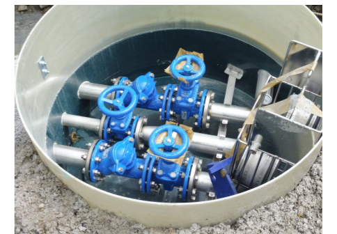
Installations techniques pour le poste de refoulement de la rue de la Foun dal Loc