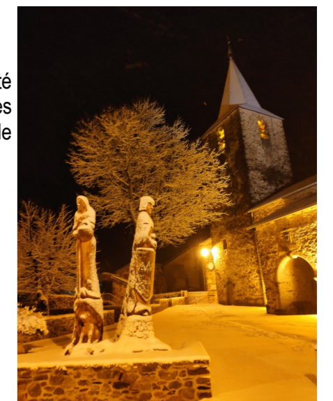
Après les chutes de neige à Nages en janvier 2023