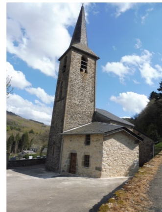
L'église Notre-Dame de Villelongue

Les 6 et 7 avril quelques habitants de Villelongue et de ses environs ont commencé le nettoyage des berges de Villelongue.