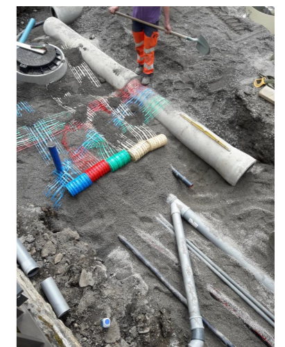
Divers réseaux de la rue de la Foun dal Loc