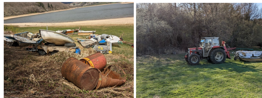
Nettoyage des berges du lac sous le hameau de Villelongue

Les 6 et 7 avril quelques habitants de Villelongue et de ses environs ont commencé le nettoyage des berges de Villelongue.