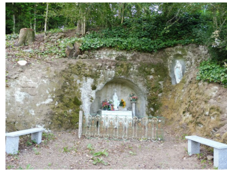
Vierge de Villelongue