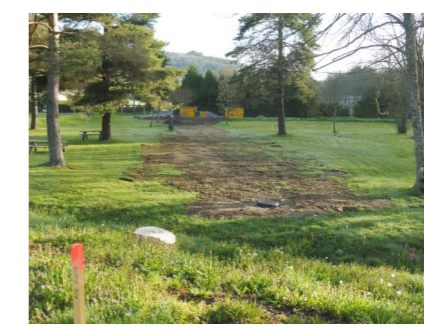
Mise en place des réseaux souterrains de la future station près du Landas